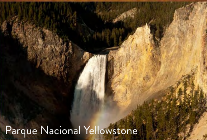
Parque Nacional Yellowstone