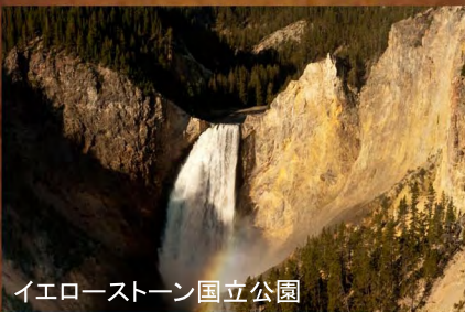
イエローストーン国立公園